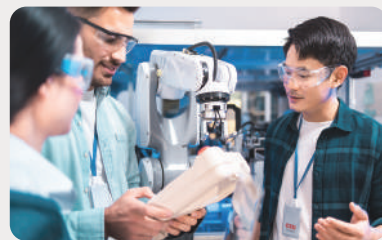
テクノロジーをお持ちの企業・研究機関

AI、画像解析、ドローン、VR・ARなど、 防災減災に活用できるテクノロジーをお持ちの方