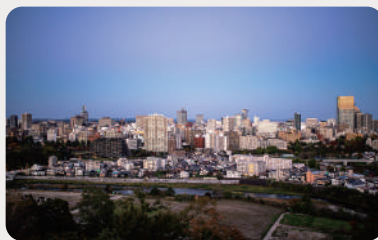
防災ソリューションを取り入れ、地域の社会サービスを向上させたい自治体