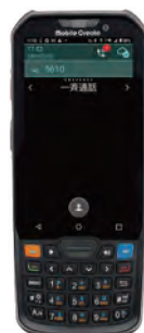
ハンディ型 IP 無線端末