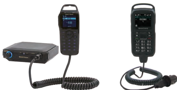
車載用 IP 無線端末